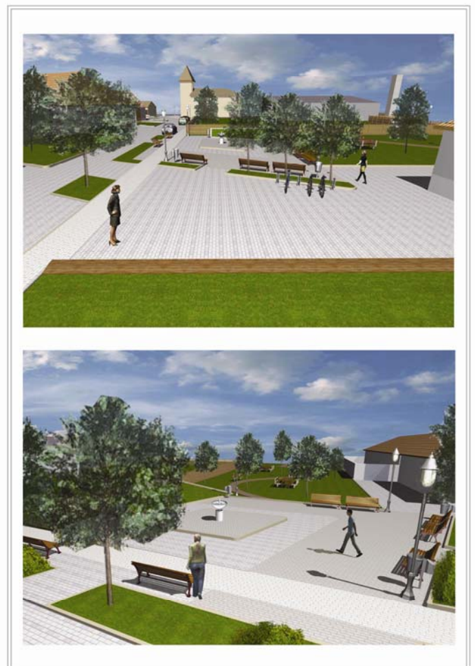
A Petőfi tér látványterve

A település kap egy rendezett főteret, mely alkalmassá válik a pihenésre. A tér kialakítása természeti, kulturális értékeink, identitás tudatunk megőrzését is segít, sőt egyedi arculatot ad községnek, hiszen rendezett közösségi teret biztosít megfelelő természeti környezetben.