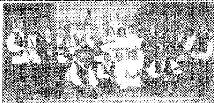
A CD-n szereplő ének- és tambura együttes

Ugyanitt kapható a kópházán ismert horvát dalok egy részét bemutató CD is.