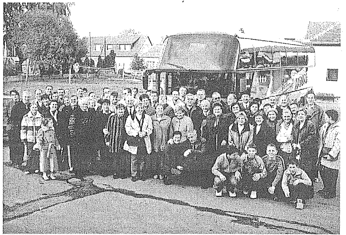
Október 25 és 26-án községünkben vendégeskedett a Gracani Kultúrcsoport. Csoportkép búcsúzás előtt.