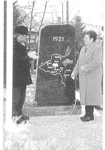
Hűség emlékmű átadás (2002. dec. 14.)